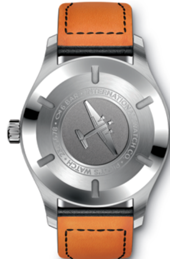
BACK VIEW for both References

Mechanical movement · Self-winding · 42-hour power reserve when fully wound · Date display · Central hacking seconds · Soft-iron inner case for protection against magnetic fields · Screw-in crown · Sapphire glass, convex, antireflective coating on both sides · Glass secured against displacement by drops in air pressure · Engraving of a JU-52 aircraft on case back · Water-resistant \infty 6 bar · Case height 11 mm · Diameter 40 mm · Calfskin strap by Santoni