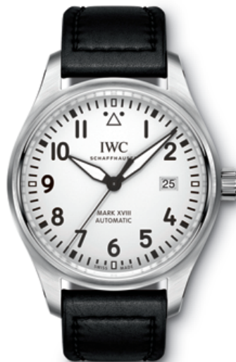
REF. IW327012 in stainless steel with silver-plated dial and black calfskin strap