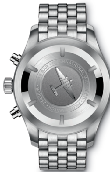
BACK VIEW for both References (illustrated is the IW377710)

Mechanical chronograph movement · Self-winding · 44-hour power reserve when fully wound · Date and day display · Stopwatch function with hours, minutes and seconds · Small hacking seconds · Soft-iron inner case for protection against magnetic fields · Screw-in crown · Sapphire glass, convex, antireflective coating on both sides · Glass secured against displacement by drops in air pressure · Engraving of a JU-52 aircraft on case back · Water-resistant \infty 6 bar · Case height 15.5 mm · Diameter 43 mm · Calfskin strap by Santoni