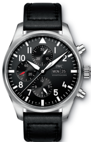
REF. IW377709 in stainless steel with black dial and black calfskin strap