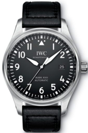
REF. IW327009 in stainless steel with black dial and black calfskin strap