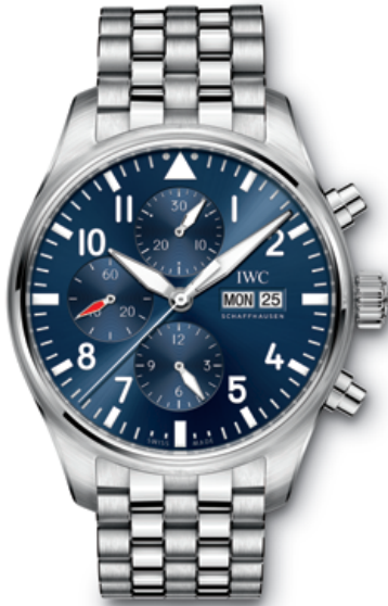
REF. IW377717 in stainless steel with blue dial and stainless-steel bracelet