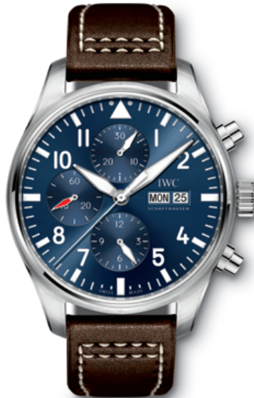
REF. IW377714 in stainless steel with blue dial and brown calfskin strap