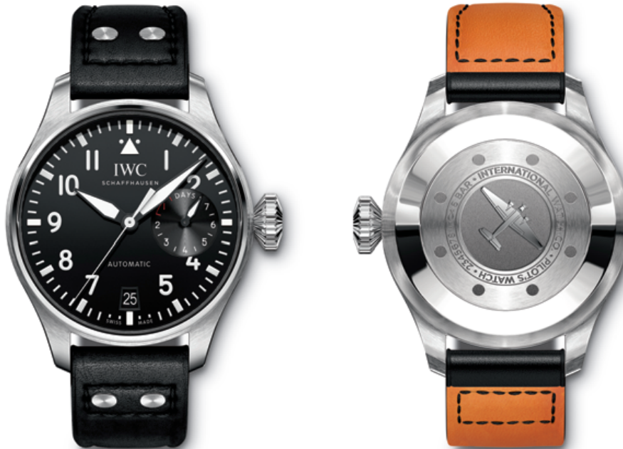
REF. IW501001 in stainless steel with black dial and black calfskin strap

Mechanical movement · Pellaton automatic winding · IWC-manufactured 52110 calibre (52000-calibre family) · 7-day power reserve when fully wound · Power reserve display · Date display · Central hacking seconds · Breguet spring · Soft-iron inner case for protection against magnetic fields · Screw-in crown · Sapphire glass, convex, antireflective coating on both sides · Glass secured against displacement by drops in air pressure · Engraving of a JU-52 aircraft on case back · Water-resistant \infty 6 bar · Case height 15.6 mm · Diameter 46.2 mm · Calfskin strap by Santoni