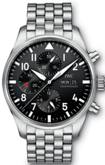
REF. IW377710 in stainless steel with black dial and stainless-steel bracelet