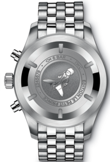
BACK VIEW for both References (illustrated is the IW377717)

Mechanical chronograph movement · Self-winding · 44-hour power reserve when fully wound · Date and day display · Stopwatch function with hours, minutes and seconds · Small hacking seconds · Soft-iron inner case for protection against magnetic fields · Screw-in crown · Sapphire glass, convex, antireflective coating on both sides · Glass secured against displacement by drops in air pressure · Engraving of "The Little Prince" on case back · Water-resistant \infty 6 bar · Case height 15.2 mm · Diameter 43 mm · Calfskin strap by Santoni