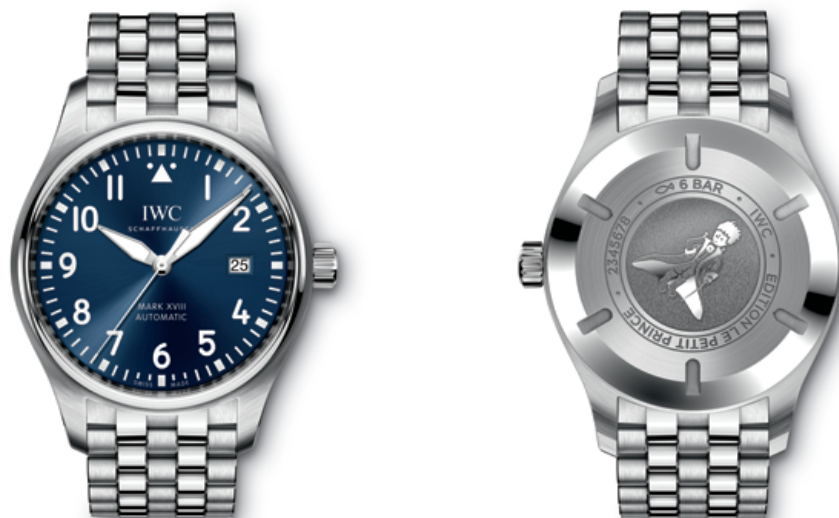
REF. IW 327016 in stainless steel with blue dial and stainless-steel bracelet

Mechanical movement · Self-winding · 42-hour power reserve when fully wound · Date display · Central hacking seconds · Soft-iron inner case for protection against magnetic fields · Screw-in crown · Sapphire glass, convex, antireflective coating on both sides · Glass secured against displacement by drops in air pressure · Engraving of “The Little Prince” on case back · Water-resistant \infty 6 bar · Case height 11 mm · Diameter 40 mm