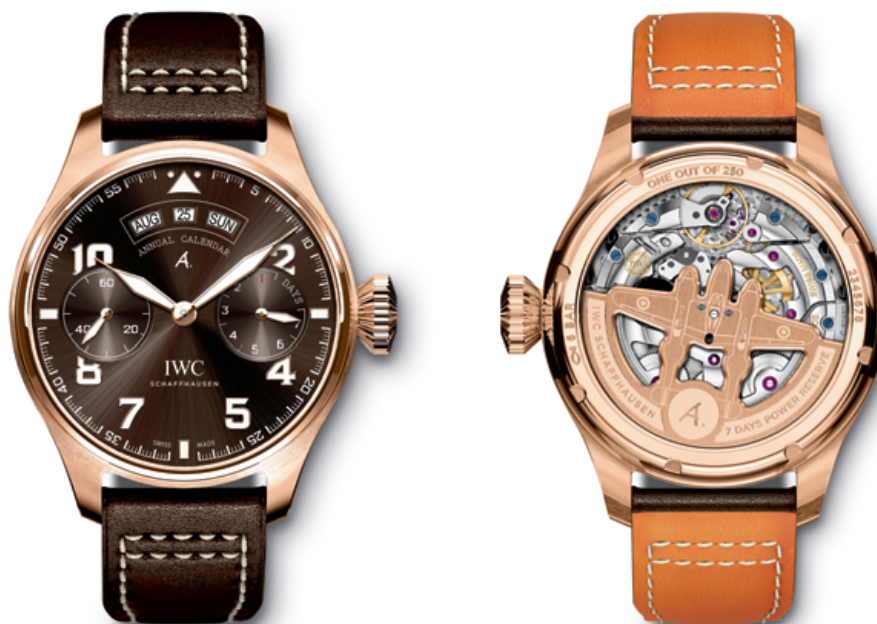
REF. IW502706 in 18-carat 5N gold with brown dial and brown calfskin strap

Limited edition of 250 watches · Mechanical movement · Pellaton automatic winding · IWC-manufactured 52850 calibre (52000-calibre family) · 7-day power reserve when fully wound · Power reserve display · Annual calendar with month, date and day · Small hacking seconds · Breguet spring · Rotor in 18-carat gold · Screw-in crown · Sapphire glass, convex, antireflective coating on both sides · Glass secured against displacement by drops in air pressure · See-through sapphire-glass back · Water-resistant \infty 6 bar · Case height 15.3 mm · Diameter 46.2 mm · Calfskin strap by Santoni