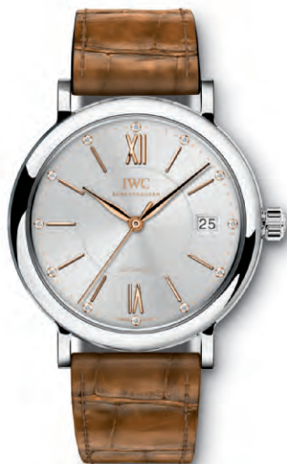
REF. IW458101 in acciaio con 12 diamanti sul quadrante e cinturino in pelle di alligatore marrone chiaro