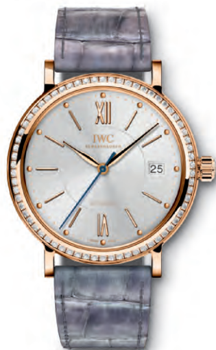
REF. IW458107 in oro rosso 18 carati con 66 diamanti sulla cassa e cinturino in pelle di alligatore lilla