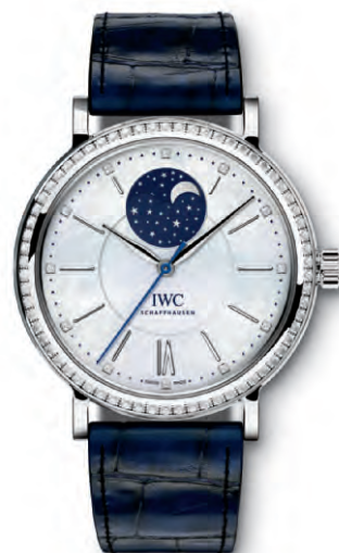
REF. IW459001 in acciaio con 66 diamanti sulla cassa, 12 diamanti sul quadrante in madreperla bianco e cinturino in pelle di alligatore blu scuro

Movimento meccanico · Carica automatica · Autonomia di marcia di 42 ore a carica completa · Secondi centrali con dispositivo di arresto · Indicazione delle fasi lunari · Vetro zaffiro bombato, antiriflesso su entrambi i lati · Impermeabile 3 bar · Spessore cassa 11 mm · Diametro 37 mm · Cinturino in pelle di alligatore di Santoni