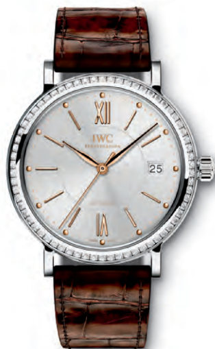
REF. IW458103 in acciaio con 66 diamanti sulla cassa e cinturino in pelle di alligatore marrone scuro