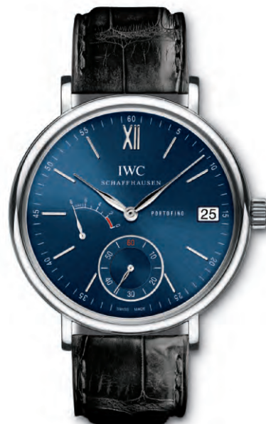
REF. IW510106 in acciaio con cinturino in pelle di alligatore nero

Movimento meccanico · Carica manuale · Calibro di manifattura 59210 (famiglia dei calibri 59000) · Autonomia di marcia di 8 giorni a carica completa · Indicazione della riserva di carica · Datario · Piccoli secondi con dispositivo di arresto · Spirale Breguet · Vetro zaffiro con accentuata bombatura, antiriflesso su entrambi i lati · Fondello trasparente in vetro zaffiro · Impermeabile 3 bar · Spessore cassa 12 mm · Diametro 45 mm · Cinturino in pelle di alligatore di Santoni