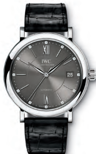
REF. IW458102 in acciaio con 12 diamanti sul quadrante e cinturino in pelle di alligatore nero