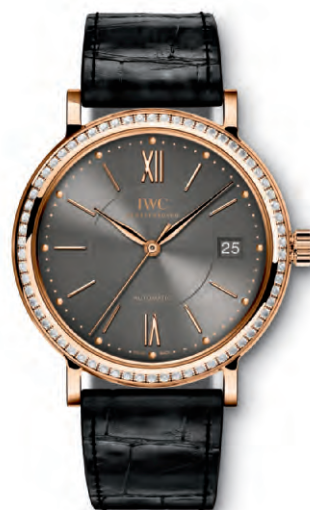
REF. IW458108 in oro rosso 18 carati con 66 diamanti sulla cassa e cinturino in pelle di alligatore nero

Movimento meccanico · Carica automatica · Autonomia di marcia di 42 ore a carica completa · Datario · Secondi centrali con dispositivo di arresto · Vetro zaffiro bombato, antiriflesso su entrambi i lati · Impermeabile 3 bar · Spessore cassa 9 mm · Diametro 37 mm · Cinturino in pelle di alligatore di Santoni