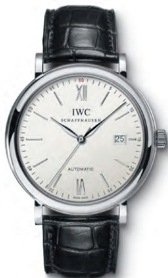
REF. IW356501 in acciaio con cinturino in pelle di alligatore nero