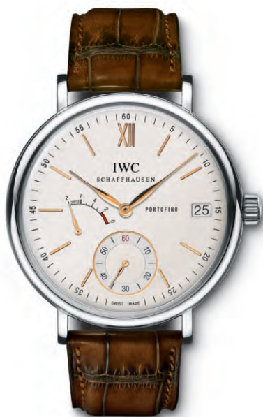
REF. IW510103 in acciaio con cinturino in pelle di alligatore marrone