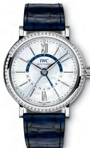
REF. IW459101 in acciaio con 66 diamanti sulla cassa, 12 diamanti sul quadrante in madreperla bianco e cinturino in pelle di alligatore blu scuro

Movimento meccanico · Carica automatica · Autonomia di marcia di 42 ore a carica completa · Lancetta delle ore regolabile a scatti di un'ora (TZC = Time Zone Corrector) · Indicazione delle 24 ore (seconda ora locale) · Secondi centrali con dispositivo di arresto · Vetro zaffiro bombato, antiriflesso su entrambi i lati · Impermeabile 3 bar · Spessore cassa 11 mm · Diametro 37 mm · Cinturino in pelle di alligatore di Santoni