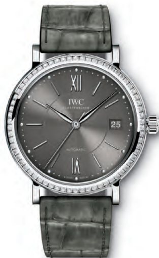
REF. IW458104 in acciaio con 66 diamanti sulla cassa e cinturino in pelle di alligatore grigio