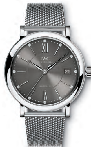
REF. IW458110 in acciaio con 12 diamanti sul quadrante e bracciale a maglia milanese in acciaio

Movimento meccanico · Carica automatica · Autonomia di marcia di 42 ore a carica completa · Datario · Secondi centrali con dispositivo di arresto · Vetro zaffiro bombato, antiriflesso su entrambi i lati · Impermeabile 3 bar · Spessore cassa 9 mm · Diametro 37 mm · Cinturino in pelle di alligatore di Santoni · Bracciale a maglia milanese in acciaio