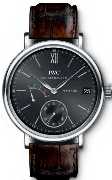
REF. IW510102 in acciaio con cinturino in pelle di alligatore marrone scuro