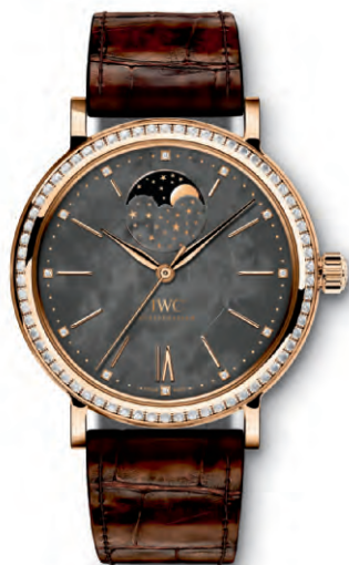
REF. IW459003 in oro rosso 18 carati con 66 diamanti sulla cassa, 12 diamanti sul quadrante in madreperla bianco e cinturino in pelle di alligatore marrone scuro