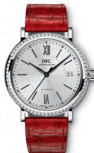
REF. IW458109 in acciaio con 66 diamanti sulla cassa e cinturino in pelle di alligatore rosso

Movimento meccanico · Carica automatica · Autonomia di marcia di 42 ore a carica completa · Datario · Secondi centrali con dispositivo di arresto · Vetro zaffiro bombato, antiriflesso su entrambi i lati · Impermeabile 3 bar · Spessore cassa 9 mm · Diametro 37 mm · Cinturino in pelle di alligatore di Santoni