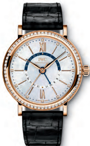
REF. IW459102 in oro rosso 18 carati con 66 diamanti sulla cassa, 12 diamanti sul quadrante in madreperla bianco e cinturino in pelle di alligatore nero