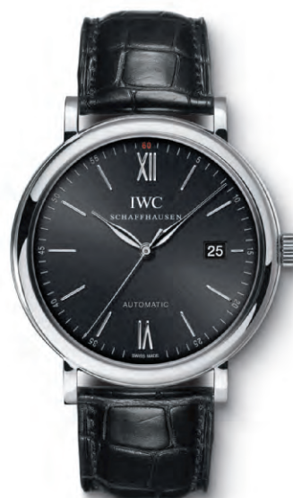
REF. IW356502 in acciaio con cinturino in pelle di alligatore nero

Movimento meccanico · Carica automatica · Autonomia di marcia di 42 ore a carica completa · Datario · Secondi centrali con dispositivo di arresto · Vetro zaffiro bombato antiriflesso su entrambi i lati · Impermeabile 3 bar · Spessore cassa 9,5 mm · Diametro 40 mm